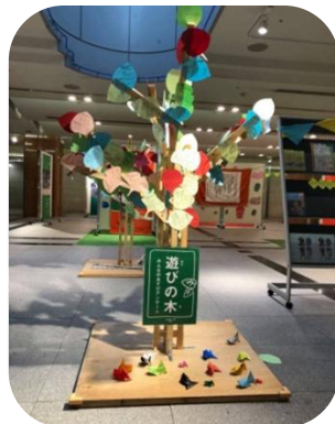
参加者のアンケート「遊びの木」