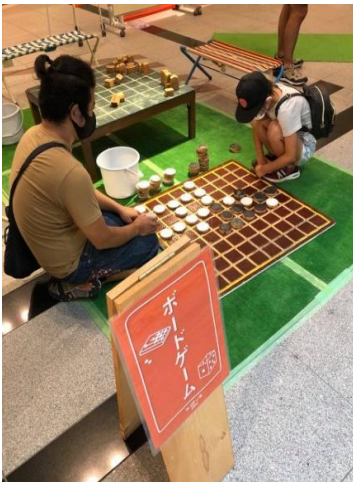
親子で対決！真剣そのもの。