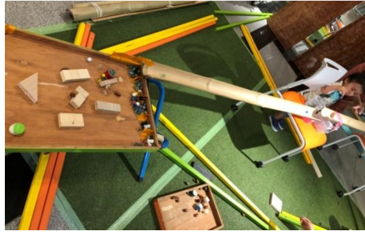
コリントゲームでもう一度コロコロ。