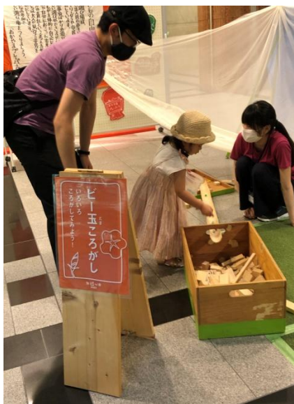
初めてのビー玉転かし