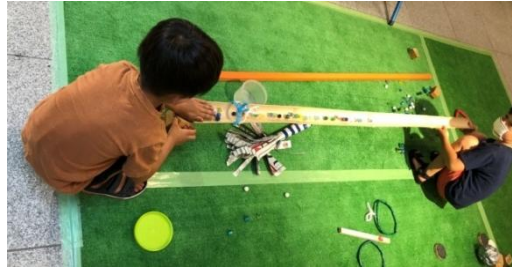
障害物を作って、どんどん転がす。