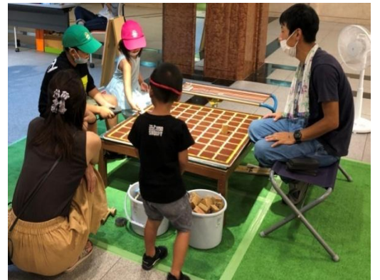
兄弟がチームとなって対決。こちらも真剣。